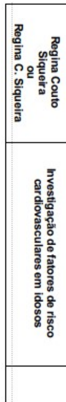
Figura 2 – Modelo de lombada