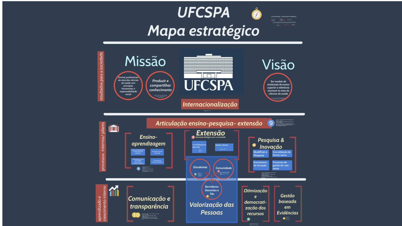
Figura 3 – Mapa Estratégico da UFCSPA

UNIVERSIDADE FEDERAL DE CIÊNCIAS DA SAÚDE DE PORTO ALEGRE