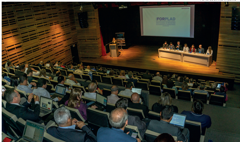
Fórum Nacional de Pró-Reitores de Planejamento e Administração

Levar o nome da UFCSPA para além das fronteiras nacionais esteve entre as atribuições dos integrantes do Escritório de Internacionalização. A universidade