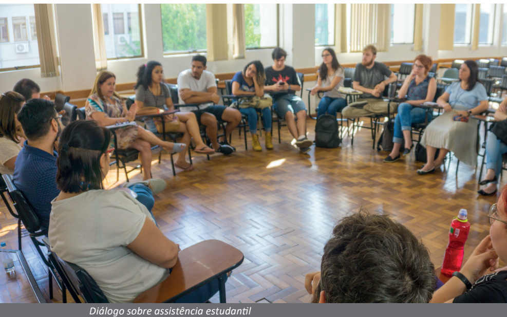
Diálogo sobre assistência estudantil

Outra proposta que acolhe as demandas da comunidade científica foi o estabelecimento de um contrato de manutenção dos equipamentos laboratoriais, com a cobertura de cerca de 1.200 itens instalados na UFCSPA. O pró-reitor explica as vantagens do contrato geral