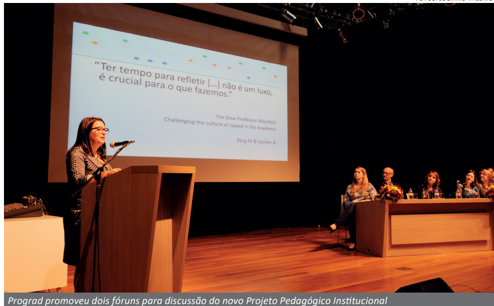
Prograd promoveu dois fóruns para discussão do novo Projeto Pedagógico Institucional

Uma solicitação antiga da parte dos alunos, as mudanças no sistema de matrícula promoveram o fim da matrícula em bloco, que impedia que os estudantes escolhessem as disciplinas