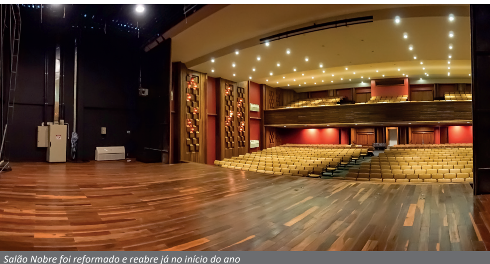
Salão Nobre foi reformado e reabre já no início do ano