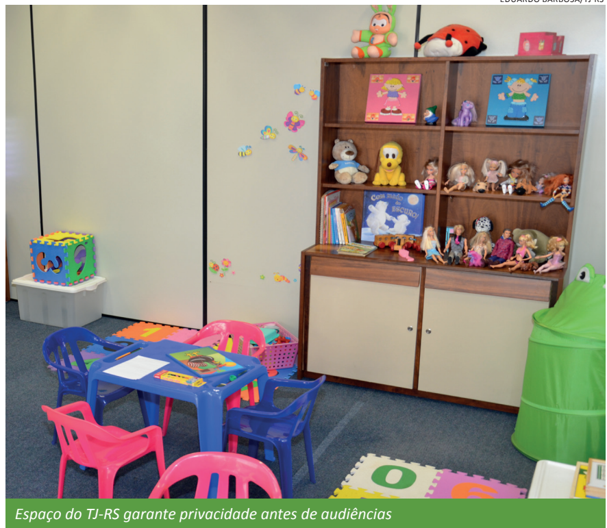
Espaço do TJ-RS garante privacidade antes de audiências

Outra ação importante do projeto é a realização de grupos reflexivos semanais com mulheres vítimas de