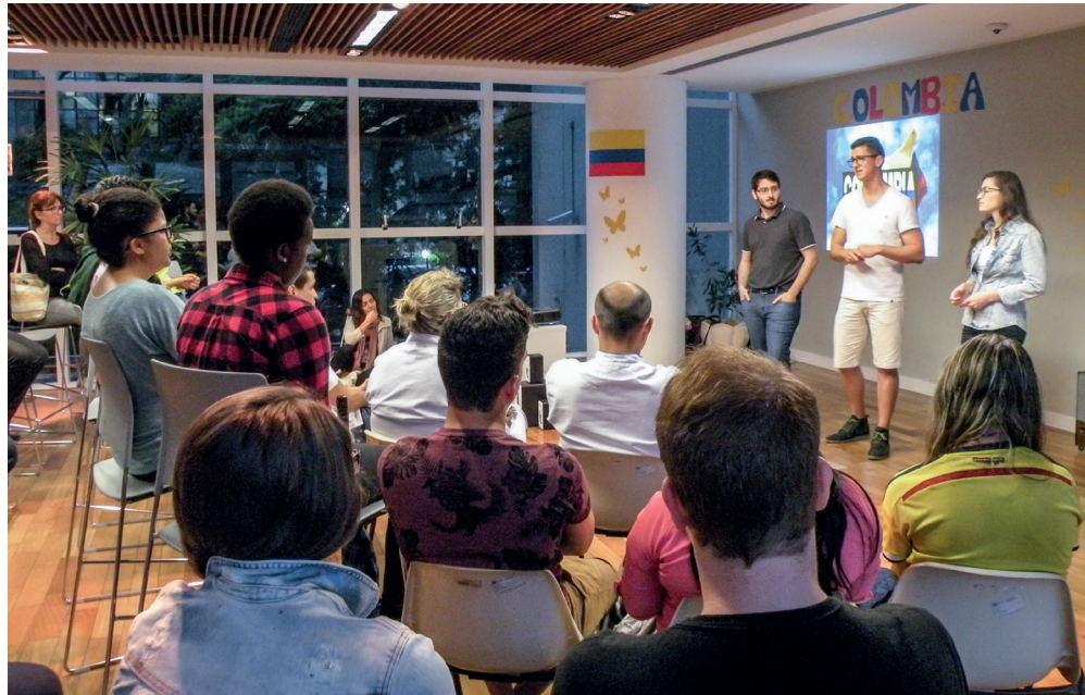
Sarau das Nações (2015) congregou estudantes da UFCSPA e acadêmicos colombianos

Embora o intercâmbio seja a faceta mais evidente da internacionalização no cotidiano universitário, como é o caso do Programa de Mobilidade da UFCSPA, que prevê auxílios para alunos interessados em estudar nas universidades estrangeiras conveniadas, a área contempla ações que vão muito além da mobilidade acadêmica. “A instituição universitária, por ser