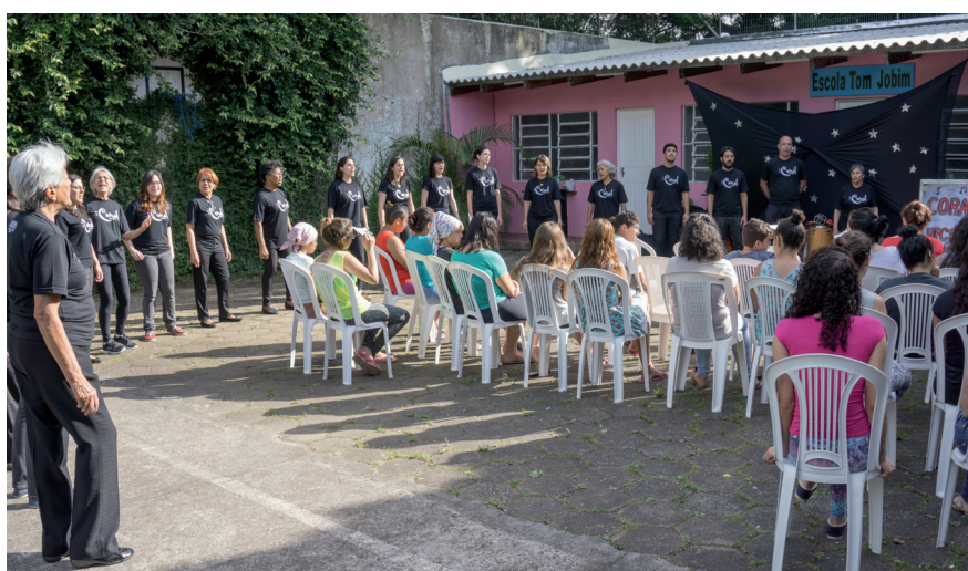
Apresentação no Centro de Atendimento Socioeducativo Feminino