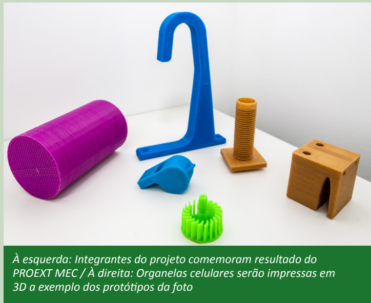
À esquerda: Integrantes do projeto comemoram resultado do PROEXT MEC / À direita: Organelas celulares serão impressas em 3D a exemplo dos protótipos da foto