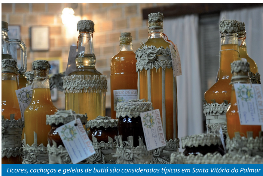
Licores, cachaças e geleias de butiá são consideradas típicas em Santa Vitória do Palmar

Os municípios investigados foram: Camaquã, Charqueadas, Jaguarão, Pelotas, Piratini, Porto Alegre, Rio Grande, Santa Vitória do Palmar e Turucu. Além de pesquisa bibliográfica e histórica, foram realizadas também entrevistas com idosos, tradicionalistas, centros comunitários, proprietá-