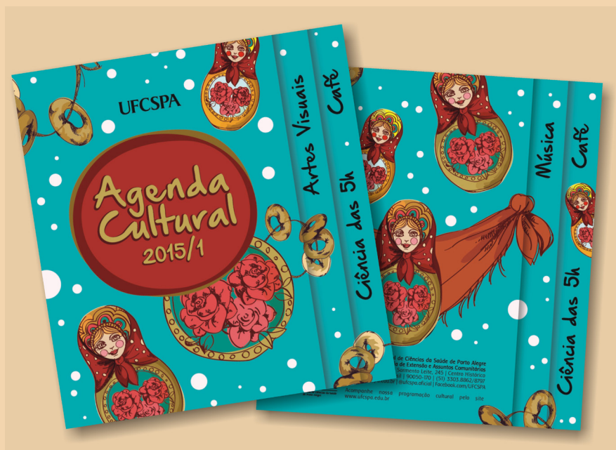
NÚCLEO CULTURAL / PROJEXT