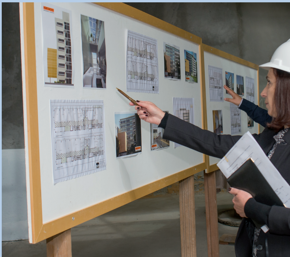
Prédio 3, localizado no campus Centro, terá oito andares e 23 laboratórios

Segundo a reitora, a ideia é lançar ainda em 2014 as licitações para a compra dos projetos complementares ao anteprojeto arquitetônico.