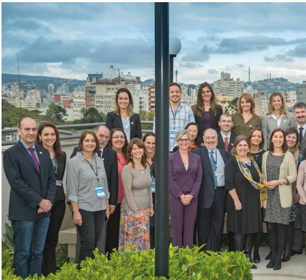
Participantes do Seminário de Gestão Estratégica

Uma das ações realizadas neste sentido foi a adesão da universidade ao Programa Gaúcho de Qualidade e Produtividade (PGQP). Realizado por uma Organização Não Governamental idealizada e controlada por empresários gaúchos, como Jorge Gerdau Johannpeter, o programa tem como objetivo diagnosticar problemas de estrutura de processos e promover melhorias em gestão.