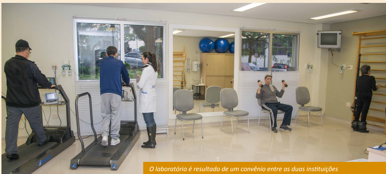
O laboratório é resultado de um convênio entre as duas instituições