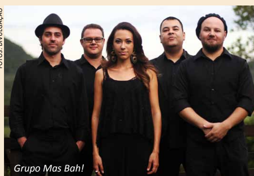
Grupo Mas Bah!