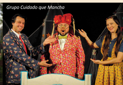
Grupo Cuidado que Mancha

vembro) e “SonoraSpinturaS” do grupo instrumental InCoMuN (novembro).