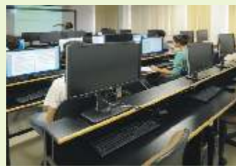
Laboratório de informática, sala 405: Aquisição de novas CPUs