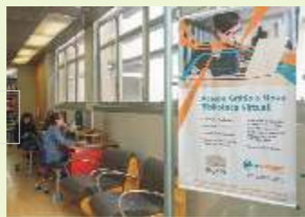
Emergency (15 títulos) e disponibilização de 1000 novos livros

Biblioteca: Aquisição da plataforma E-volution (95 títulos), Access Medicine (75 títulos), Access