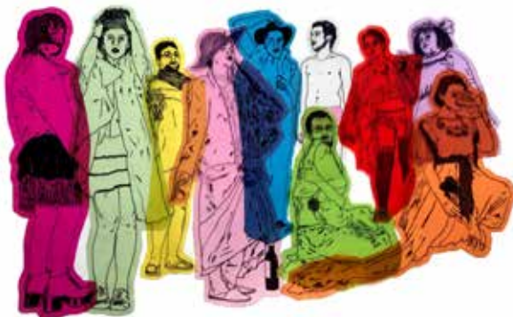
“Coloridinhos”, 2017, caneta permanente sobre papel celofane e acetato, 52 x 36 cm